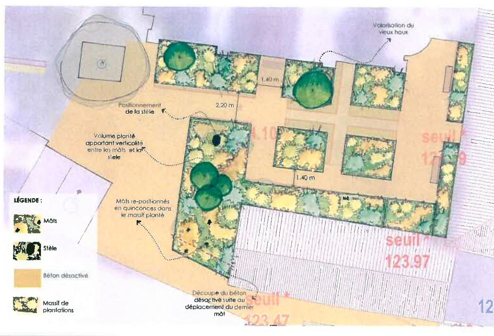
PROPOSITION N°2 / ECHELLE 1/100 ÈME

Ce plan n'apporte pas d'observation particulière, la position des mâts sera revue lors de la réunion technique du 31 janvier avec l'agence CANOPEE.